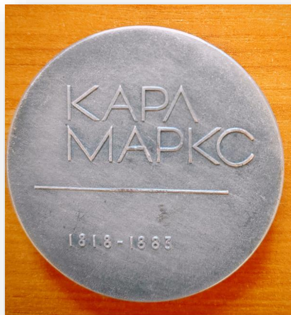
4. Настольная медаль «Карл Маркс 1818-1883»