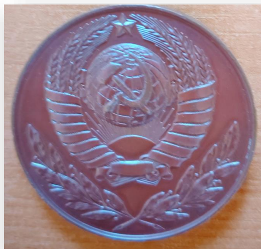
7. Настольная медаль «В ознаменование 100-летия со дня рождения И.В. Мичурина 1855-1955»