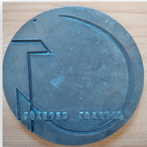
35. Настольная медаль «За Власть Советов 1918-1968»