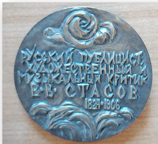
18. Настольная медаль «Русский публицист, художественный и музыкальный критик В. В. Стасов 1824-1906»