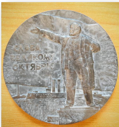
37. Настольная медаль «Слава великому октябрю»