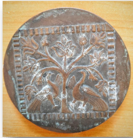
34. Настольная медаль «Город Владимир. Дмитриевский собор»