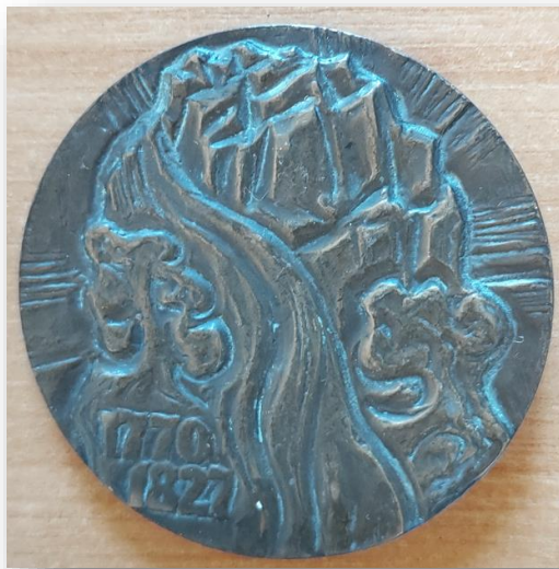
16. Настольная медаль «Людвиг Бетховен 1770-1827»