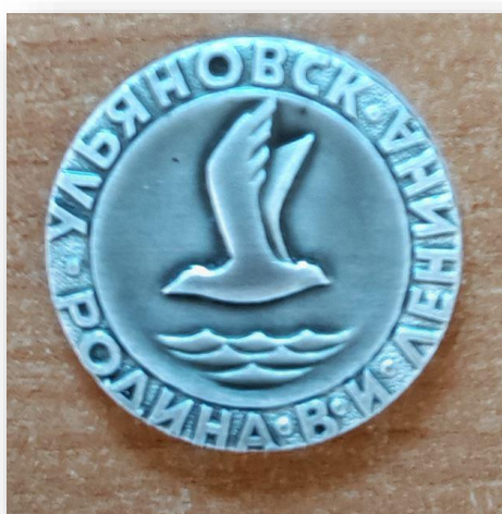
41. Настольная медаль (жетон) «Ульяновск - родина В.И. Ленина»