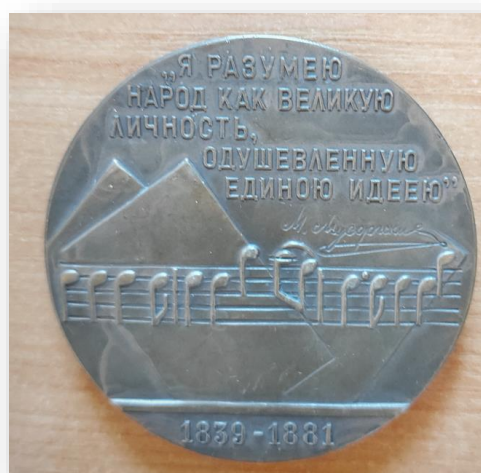
15. Настольная медаль "Мусоргский 1839-1881"

«Я разумею народ как великую личность, одушевленную единою идеею» М. Мусоргский