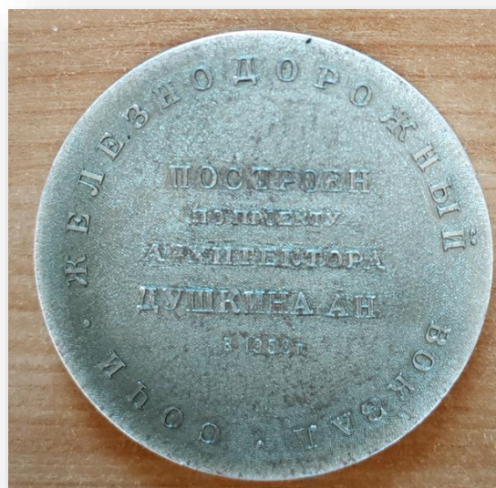
28. Настольная медаль «Советские железные дороги. Железнодорожный вокзал. Сочи»

Реверс – надписи: «Построен по проекту архитектора Душнина А.А. в 1952 г.»