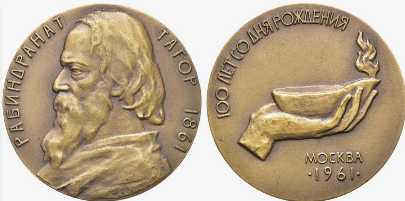
6. Настольная медаль «100 лет со дня рождения Рабиндранат Тагор»