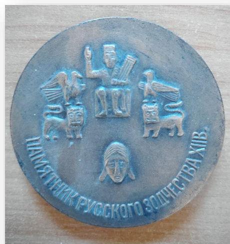
33. Настольная медаль "Храм Покрова на Нерли". Внизу по окружности расположена надпись: "ПАМЯТНИК РУССКОГО ЗОДЧЕСТВА XII В."