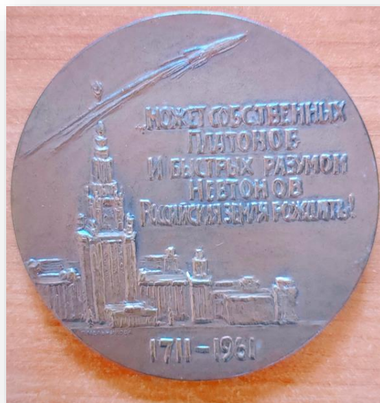
3. Настольная медаль «Михаил Ломоносов 1711-1961 Может собственных Платонов и быстрых разумов Невтонов Российская земля рождать!»