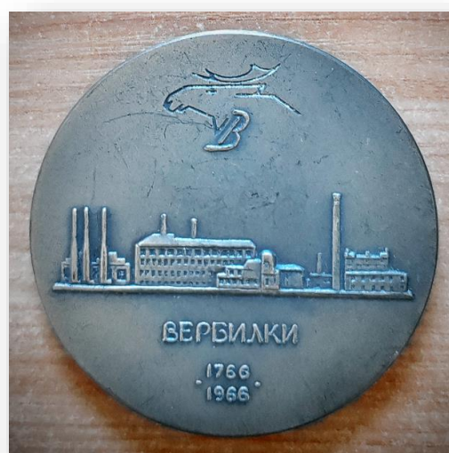
24. Настольная медаль «200 лет Дмитровскому фарфоровому заводу Вербилки 1766-1966»