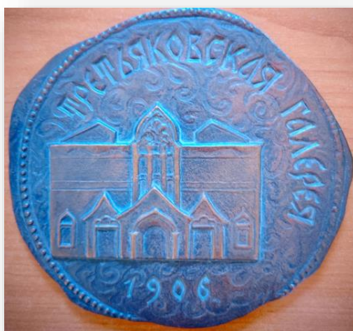
23. Настольная медаль «Третьяковская галерея 1906»