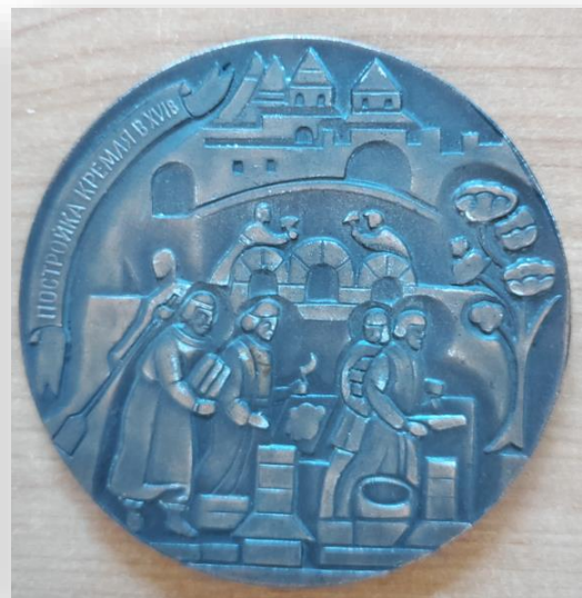
26. Настольная медаль «Памятник Русского зодчества. Москва. Кремль»