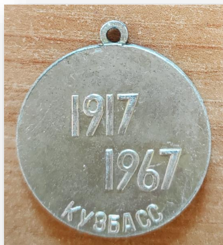
42. «50 лет Советской власти 1917-1967»