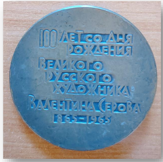
10. Настольная медаль «100 лет со дня рождения Валентина Серова 1865-1965»