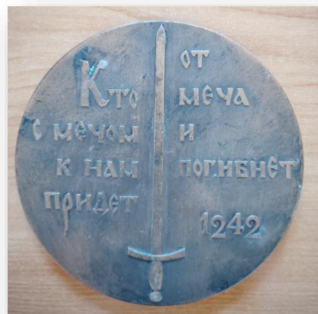
36. Настольная медаль «Кто с мечом к нам придет - от меча и погибнет 1242»