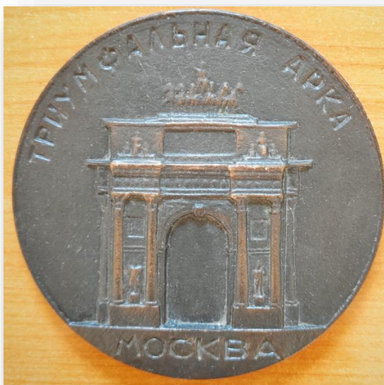
38. Памятная медаль «Триумфальная Арка в Москве»