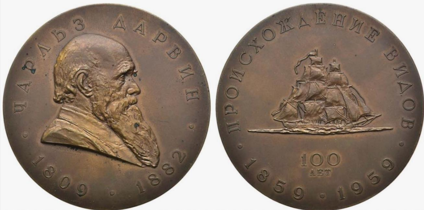
5. Настольная медаль «Чарльз ДАРВИН 100 лет ПРОИСХОЖДЕНИЕ ВИДОВ. Парусник СССР»