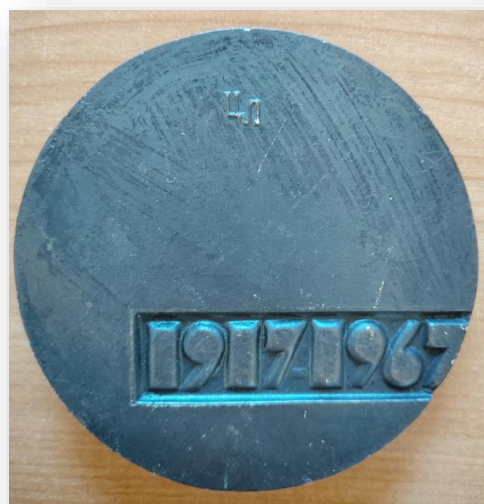
29. Настольная медаль «50 лет становлению советской власти 1917-1967»