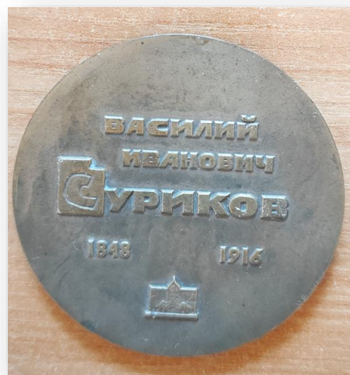
21. Настольная медаль «Василий Иванович Суриков 1848-1916»