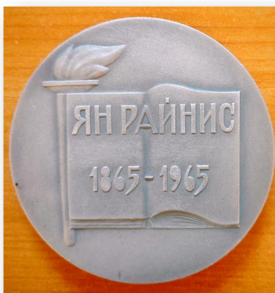
2. Настольная медаль "1865-1965 Ян Райнис"