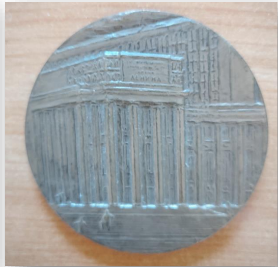
25. Настольная медаль «100 лет Государственной библиотеке СССР им. В. И. Ленина 1862-1962»