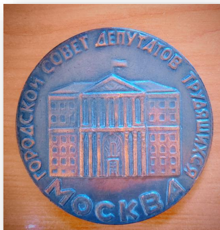
22. Настольная медаль «МОСКВА, Городской совет депутатов трудящихся»