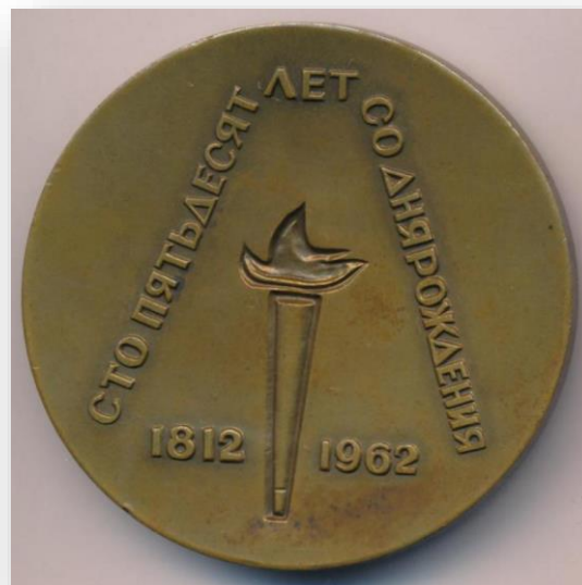
13. Настольная медаль "150 лет со дня рождения А.И. Герцена"