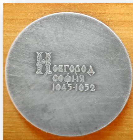
39. Настольная медаль «Новгород София 1045-1052»