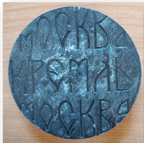
27. Настольная медаль «Москва Кремль»