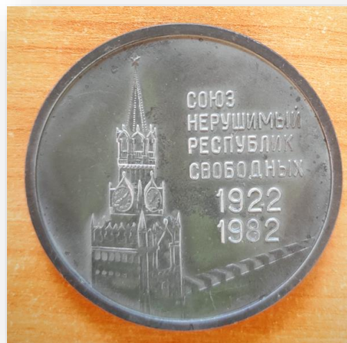
32. Настольная медаль «60 лет Союзу Советских Социалистических Республик 1922-1982»