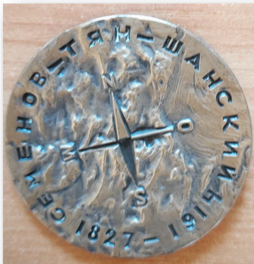
17. Настольная медаль «Семенов-Тян-Шанский. 1827-1914»