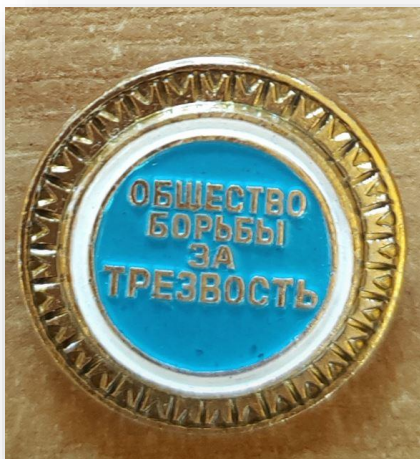
40. Значок «Общество борьбы за трезвость»