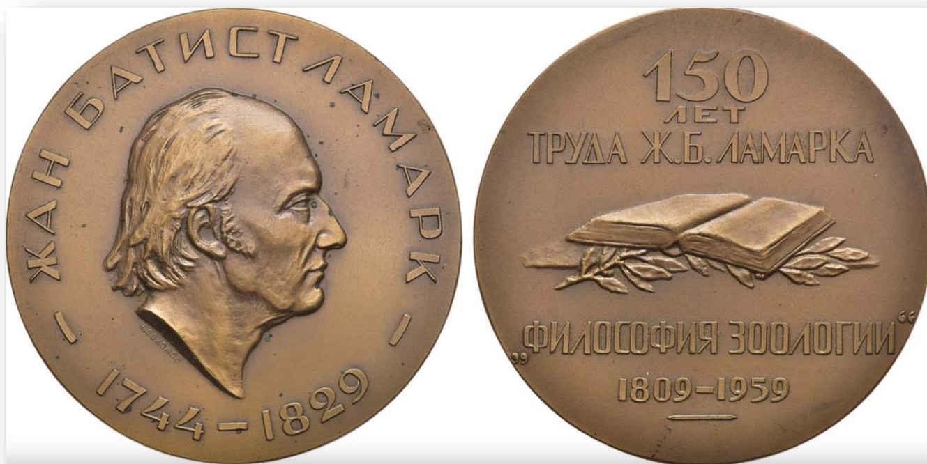
1. Настольная медаль «150 лет со дня выхода в свет труда Ж. Б. Ламарка „Философия зоологии“»

«Философия зоологии» — основной теоретический труд Ламарка, в котором впервые изложена гипотеза исторического (эволюционного) развития организмов.