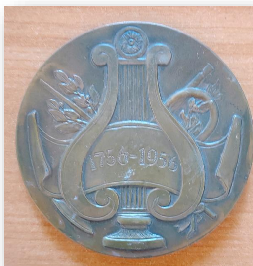
14. Настольная медаль «Моцарт В. А. 1756-1956»