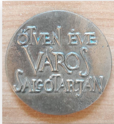
31. Настольная медаль «OTVEN EVE VAROS SALGOTARJAN»