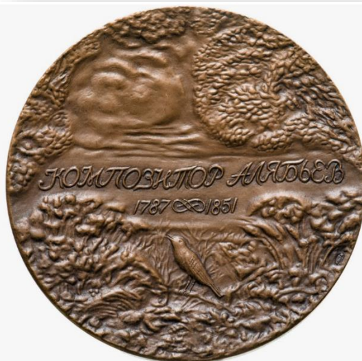
8. Настольная медаль "Композитор Алябьев 1787-1851"