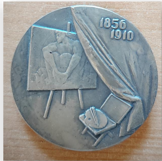
19. Настольная медаль «Врубель. 1856–1910»