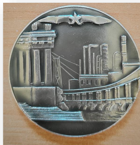
30. Настольная медаль «Город Герой-Волгоград»